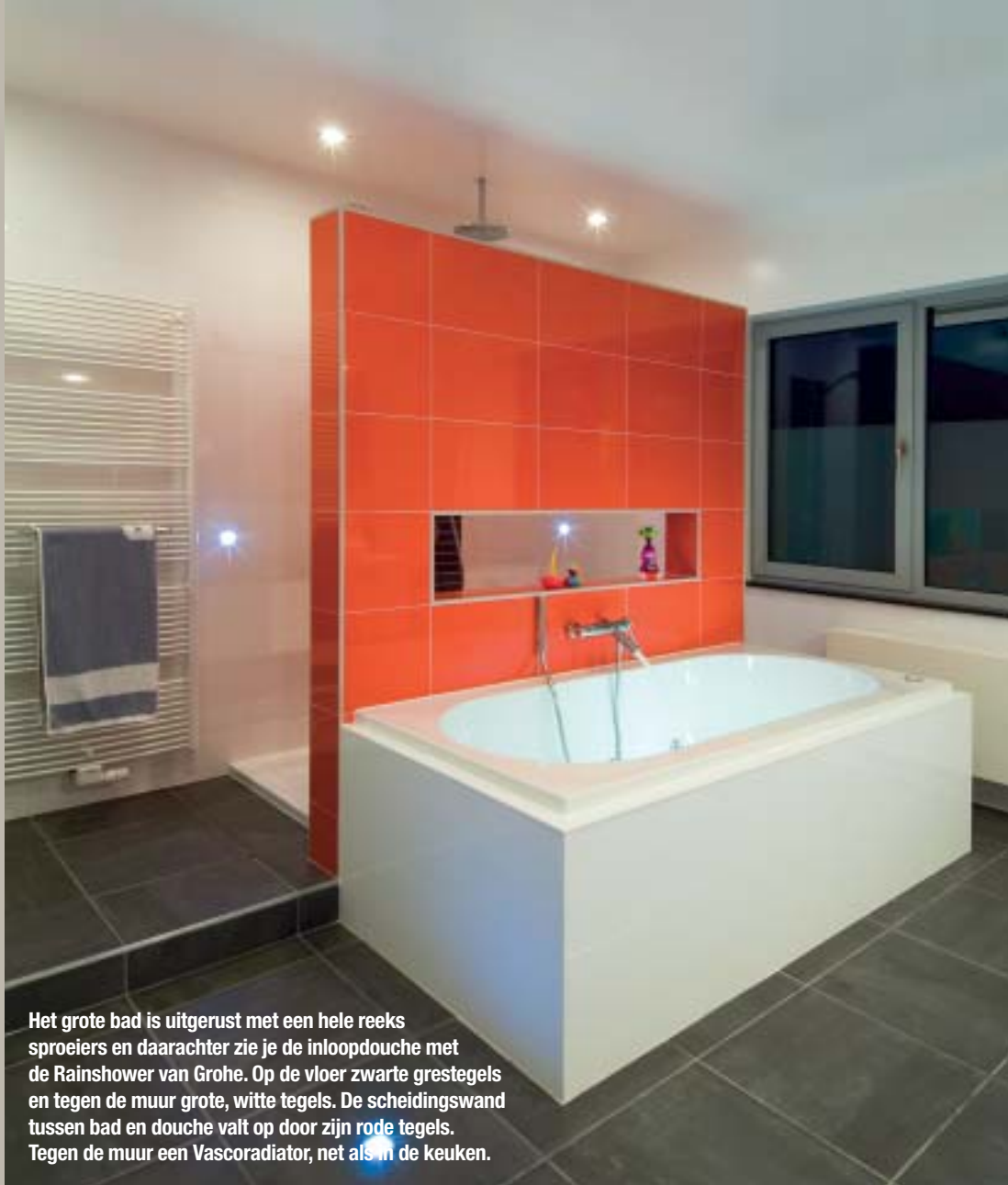
Het grote bad is uitgerust met een hele reeks sproeiers en daarachter zie je de inlopdouche met de Rainshower van Grohe. Op de vloer zwarte grestegels en tegen de muur grote, witte tegels. De scheidingswand tussen bad en douche valt op door zijn rode tegels. Tegen de muur een Vascoradiator, net als in de keuken.