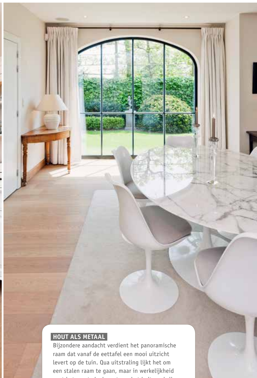
Foto links: tussen de leefruimte en de hal bevindt zich de enige stalen deur in huis. De andere binnendeuren zijn van hout. Foto rechts: de leefruimte in één grote, open ruimte met plaats voor een eethoek, een zithoek en een tv-hoek. Blickvangers in de eethoek zijn de marmeren tafel Tulip en de gelijknamige designstoelen, allemaal ontwerpen van Eero Saarinen voor Knoll, gekocht bij Final Touch in Knokke.

Op nagenoeg de hele benedenverdieping ligt eikenhouten parket op de vloer. Het gaat om parket met een toplaag van tien millimeter dat elke tien jaar afgeschuurd moet worden en dankzij de waterdichte afwerking van Monocoat enkel met een vochtige doek gereinigd hoeft te worden.