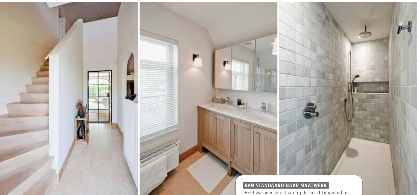
Foto rechts: in de ouderlijke badkamer kozen de bewoners voor een bijzondere douchebekleding: marmeren tegels van 10 x 10 cm.