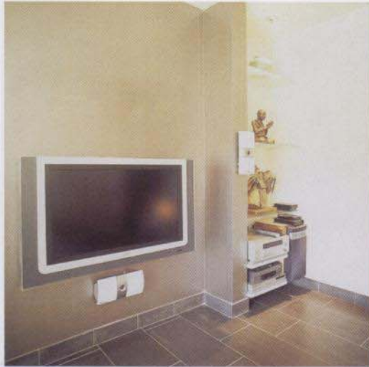
Foto 5: De achtergevel bestaat voor een groot deel uit glas. Daardoor baadt de woonkamer in een grote hoeveelheid licht.