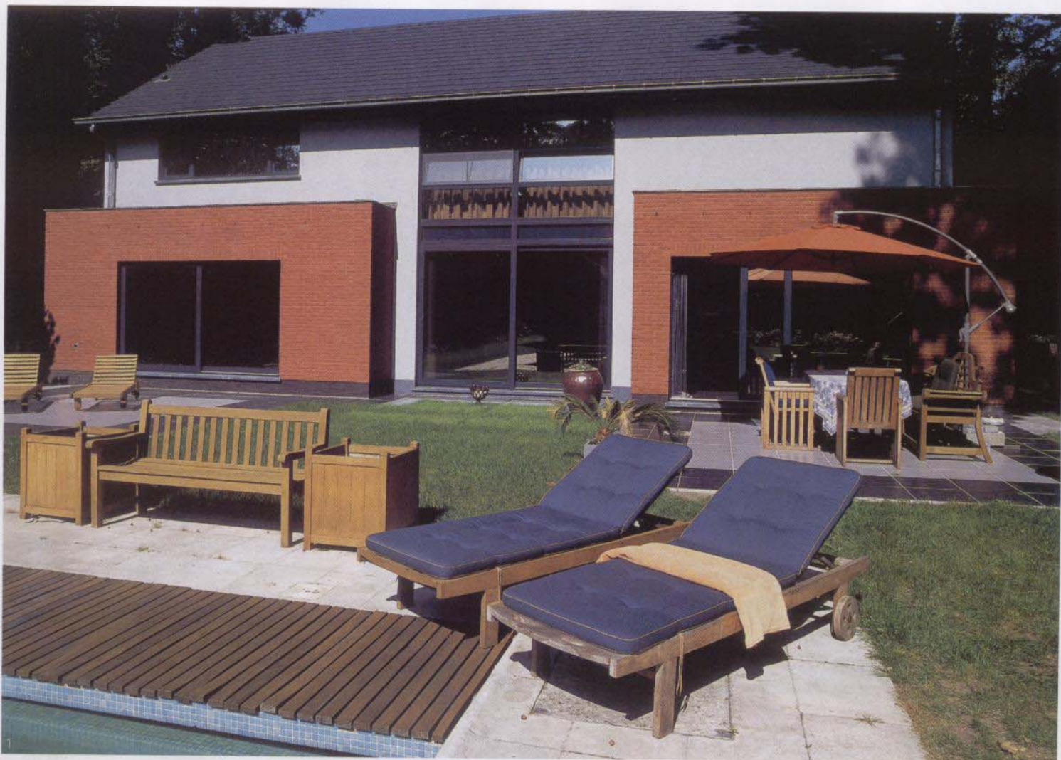
Foto 1: De combinatie tussen de rode terracota, de grijze crepie en de blauwe hemel zorgt voor een kleurrijk spektakel.