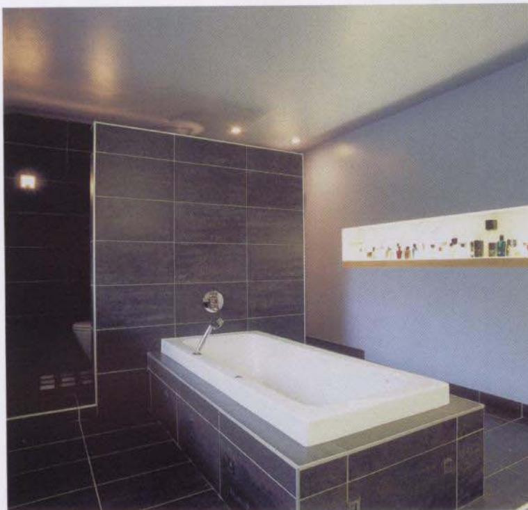
Foto 8: De symmetrische kracht die van de badkamer uitgaat, wordt geaccentueerd door de grote spiegel.

Foto 7: Tussen de badkamer en de slaapkamer bevindt zich een grote schuifdeur met patrijspootjes. Het schuifstelsel is afkomstig uit Italië.